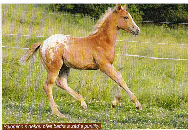
Palomino s dekou přes bedra a záď s puntíky.

(Variantou leoparda je zbarvení few spot leopard – prakticky bílý kůň na 90 % těla s nepatrnými odznaky.)