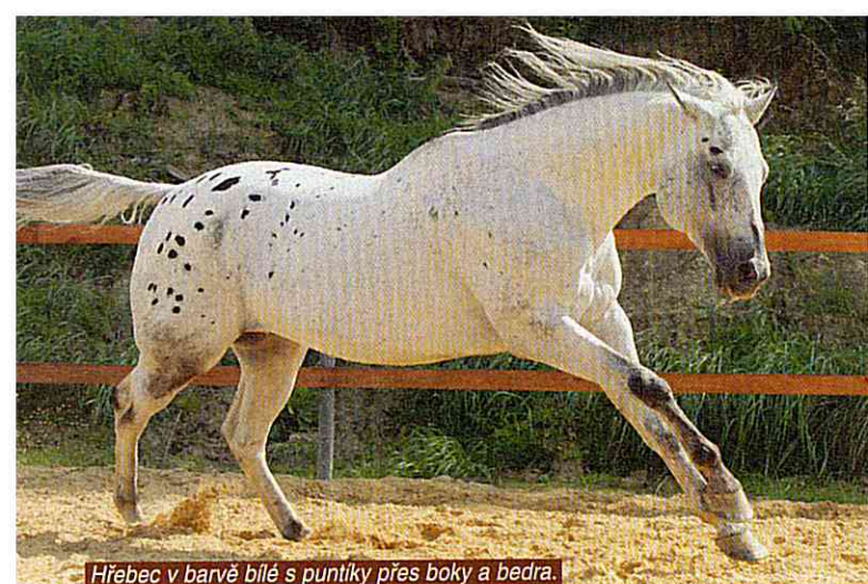
Hřebec v barvě bílé s puntíky přes boky a bedra.

a bílých chlupů. Hřívá a ocas mají být stejné, jako základní barva zvířete a mohou být smíchány s bílými žíněmi. Proto se mají jevit hřívá a ocas koně red roan jako červené.