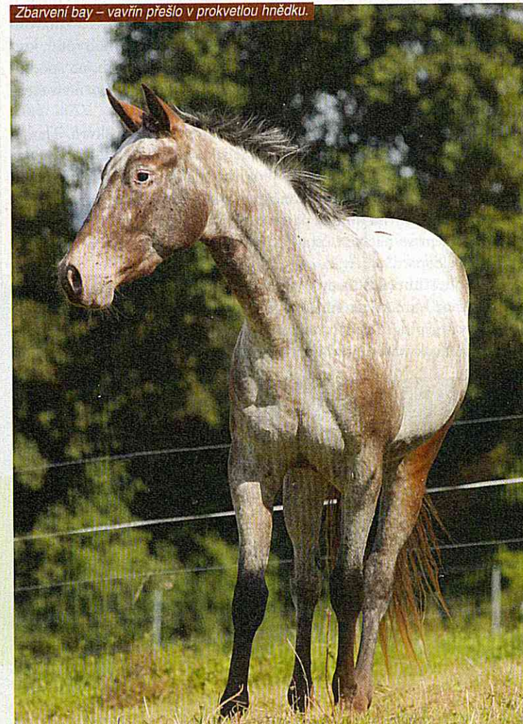
Zbarvení bay – vavřík přešlo v prokvetlou hnědku.